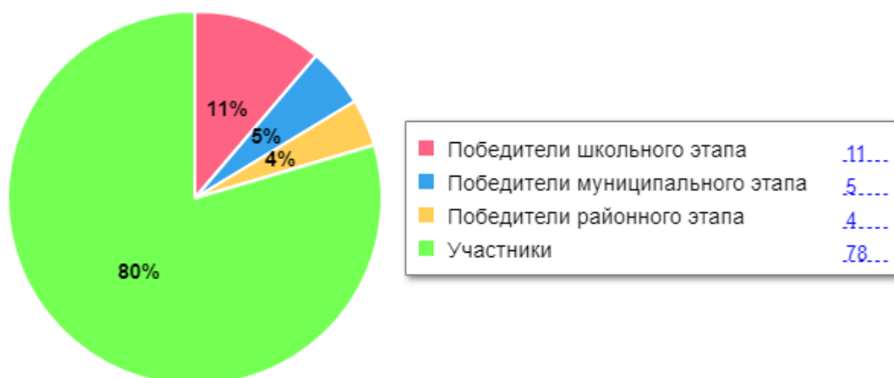
Диаграмма по результатам участия школьников во ВсОШ

В 2023 году был проанализирован объем участников конкурсных мероприятий разных уровней. Дистанционные формы работы с учащимися, создание условий для проявления их познавательной активности позволили принимать активное участие в дистанционных конкурсах регионального, всероссийского и международного уровней. Результат – положительная динамика участия в олимпиадах и конкурсах, привлечение к участию в интеллектуальных соревнованиях большего количества обучающихся Школы.